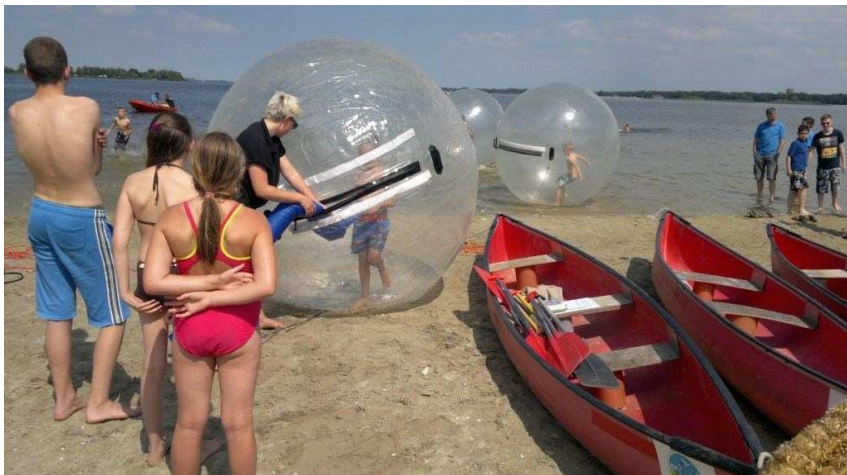
Foto: Puur Zeewolde, kleine watersportdagen