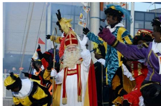
Foto: intocht Sinterklaas

Hoewel er meerdere definities voor volksfeesten zijn, verstaan we in het kader van deze nota onder volksfeesten de jaarlijks, zich herhalende traditionele feesten en evenementen. Ze horen bij onze cultuur en hebben een nationaal karakter. Dit zijn bijvoorbeeld het Koningsfeest en de intocht van Sinterklaas. We vinden het in het algemeen belang dat deze feesten doorgang vinden en degelijk georganiseerd worden. Om die reden willen wij in bepaalde mate financiële ondersteuning bieden in de vorm van subsidies, wanneer dat noodzakelijk blijkt.